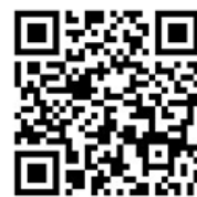
報名網站 QR CODE